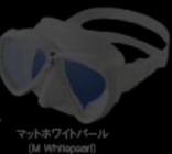
マットホワイトパール (M Whitepearl)

GM-1243 マンティスLV ホワイトシリコン UV400CUTアンバー ¥18,000 +税