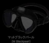
マットブラックパール (M Blackpearl)

GM-1244 マンティスLV ブラックシリコン UV400CUTクリア ¥18,000 +税