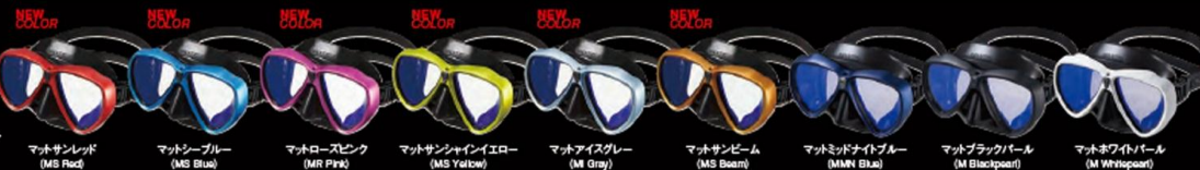
マットサンレッド (MS Red)

GM-1243 マンティスLV ブラックシリコン UV400CUTアンバー ¥18,000 +税