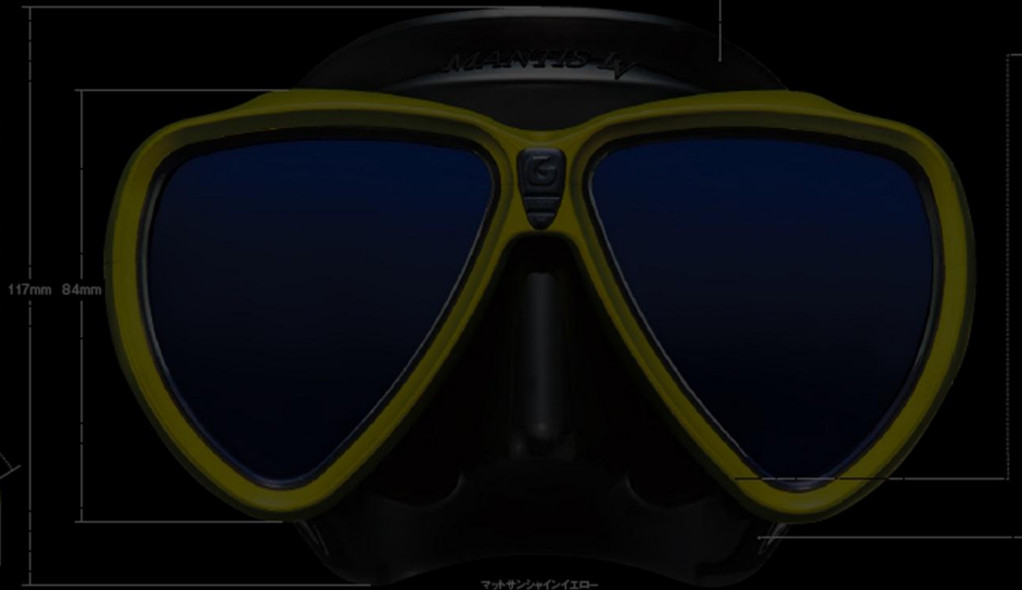
マットサンシャイエロー (MS Yellow)