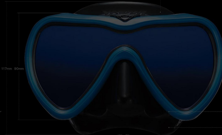
メタシーブルー (MTS Blue)