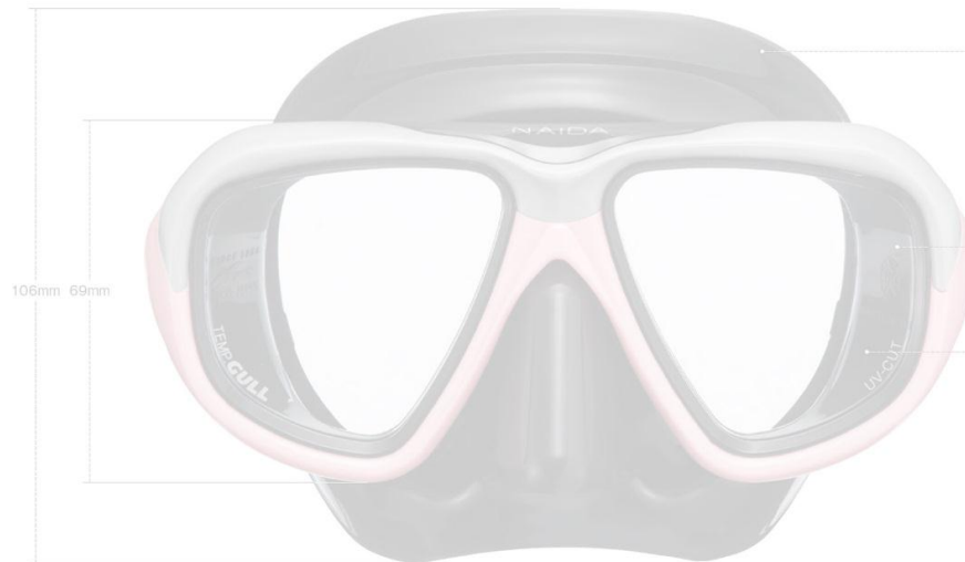
サンドグレー × サクラピンク (S Gray × S Pink)

【UV-A】長い年月の間に目に吸収され蓄積し、目に有害となる。【UV-B】ほとんどはオゾン層で吸収されるが、一部が地表へ到達し、目に有害である。【UV-C】オゾン層で吸収され、地表には到達しない。