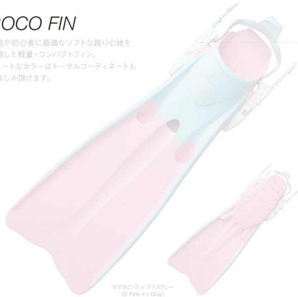
サクラピンク × アイスグレー (S Pink × I Gray)

女性や初心者に最適なソフトな蹴り心地を実現した軽量・コンパクトフィン。 キュートなカラーはトータルコーディネートもお楽しみ頂けます。