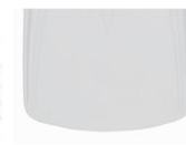
MEW フーツ適応参考表

水を捕える ブレード先端ライン フィンキック時に最後までしっかりと水を捕える事で、ラバーの反発弾性を存分に活かし、確かな推進力を実現します。