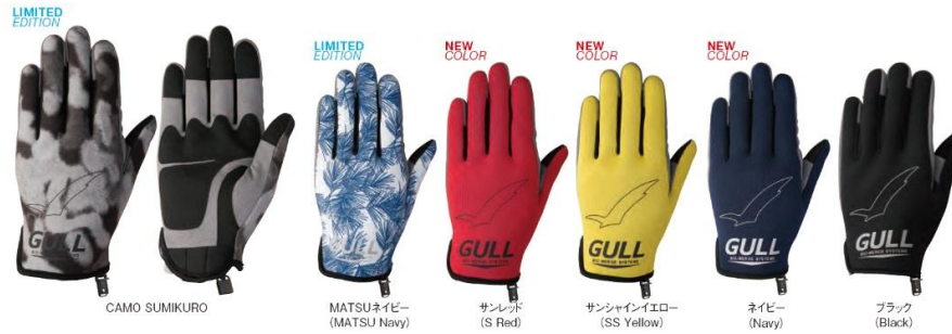
GA-5572A / GA-5573A LIMITED EDITION SPグローブショート メンズ [オープンブライス]

○ サイズ: M / L / XL ○ 素材: アマール (人工皮革) / 2mmオベロンジャージ ○ 保管に便利なフック付き ○ クイックマウントシステム採用