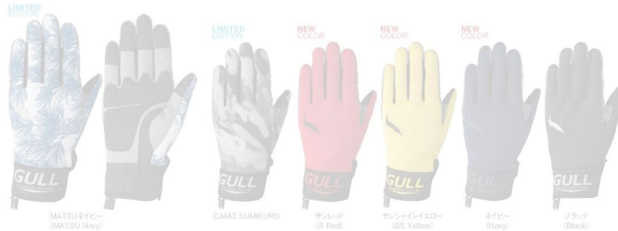
GA-5570A / GA-5571A LIMITED EDITION SPグローブ メンズ [オープンブライス]

3つの季節に使用出来るオールラウンドモデル。耐久性に優れ男女の手に合わせて設計でフィット性が高く、着脱もスムーズに。