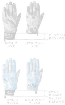
グローブのサイズ比較