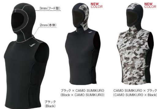
ブラック × CAMO SUMIKURO (Black × CAMO SUMIKURO)